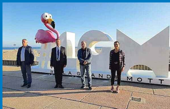
Statue monumentale à La Grande-Motte