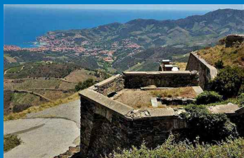
La batterie des 500 à Port-Vendres

Votre marque ou votre logo à la Une de La Lettre T 1 an / 1400 € Infos : 04 67 72 31 41 ou lalettret@free.fr