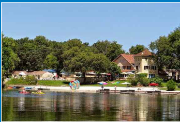
Whaka Lodge, un ecoresort lifestyle dans le Gers Pleins Feux : p. 8