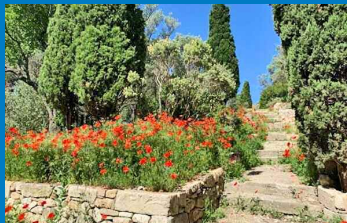
Les jardins de l'abbaye St-André