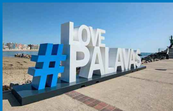
Statue monumentale à Palavas