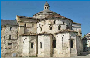
L'église abbatiale de Souillac