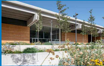
Des vignes au musée Narbo Via